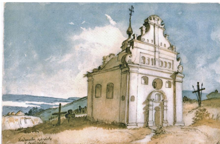
Рис.2. Т.Шевченко. Богданові руїни у Суботіві. 1845р. Папір, акварель

Замальовки чисельних пам'яток Т.Шевченко виконував у техніці акварелі, яку успішно застосовував під час навчання у Петербурзькій академії мистецтв. «Становлення Тараса Шевченка як аквареліста, безумовно, відбувалося під впливом вчителя Карла Брюллова. Вплив К.Брюллова: певна ідеалізація зображуваного, романтична піднесеність, деяка умовність колориту. Для акварелей Т.Шевченка, виконаних упродовж 1845 року, характерним є нанесення рисунка олівцем. Колористична гама – стримана, із застосуванням переважно коричневих та блакитних тонів. Гортаючи сторінки альбому 1845 року, з яким художник подорожував з весни до осені, переконуємося у надзвичайному захопленні і зацікавленості Т.Шевченка архітектурною спадщиною, помічаємо ретельну прорисовку об'єктів, прагнення якомога точніше передати пластичні якості форми споруд» [10; 80].