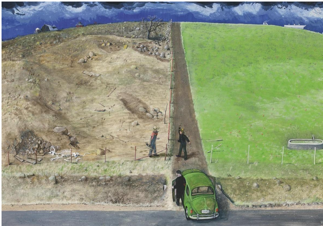
Рис. 3. Курилик В. Тайнство покаяння. Мішана техніка, дошка. 61 x 61 см. Приватна колекція. URL : http://www.sothebys.com/fr/auctions/ecatalogue/lot.19.html/2012/null-t00141

Трагізм братонищення втілений у картині «Він ненавидить наш скептицизм» (1972), де художник посеред нічного мегаполіса розгортає жовтогаряче пшеничне поле, обтяжене щедрим урожаєм полонених тіл і душ, усяєне людиноподібним колоссям, по якому мчить трактор, яким керує чорт в образі заможного фермера. Другорядні персонажі (снопи зі скошених людських тіл) слугують для увиразнення характеру головної особи. У цих численних постатях втілені різні світогляди, альтернативні до центрального персонажа твору. Цей твір є своєрідною сагою про щасливий добробут ціною втрат морально-духовних цінностей. У сюжеті помітні й релігійні конотації: батько як невіруючий Фома, який картає себе через релігійну «перверсію», переживаючи самотність на тлі непростого вибору своєї долі.