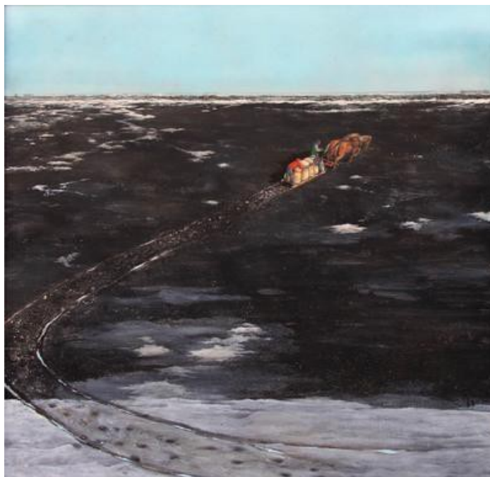
Рис. 2. Курилик В. Земля тяжким горем так сильно засіяна. 1970 р. Олія, панель, 120x120. Приватна колекція. URL : https://www.mayberryfineart.com/artwork/X29-57E-193

твір «Земля тяжким горем так сильно засіяна» (1970), що показує безкраї канадські чорноземи, на тлі яких батько із сином і парою коней провадять щоденну працю.